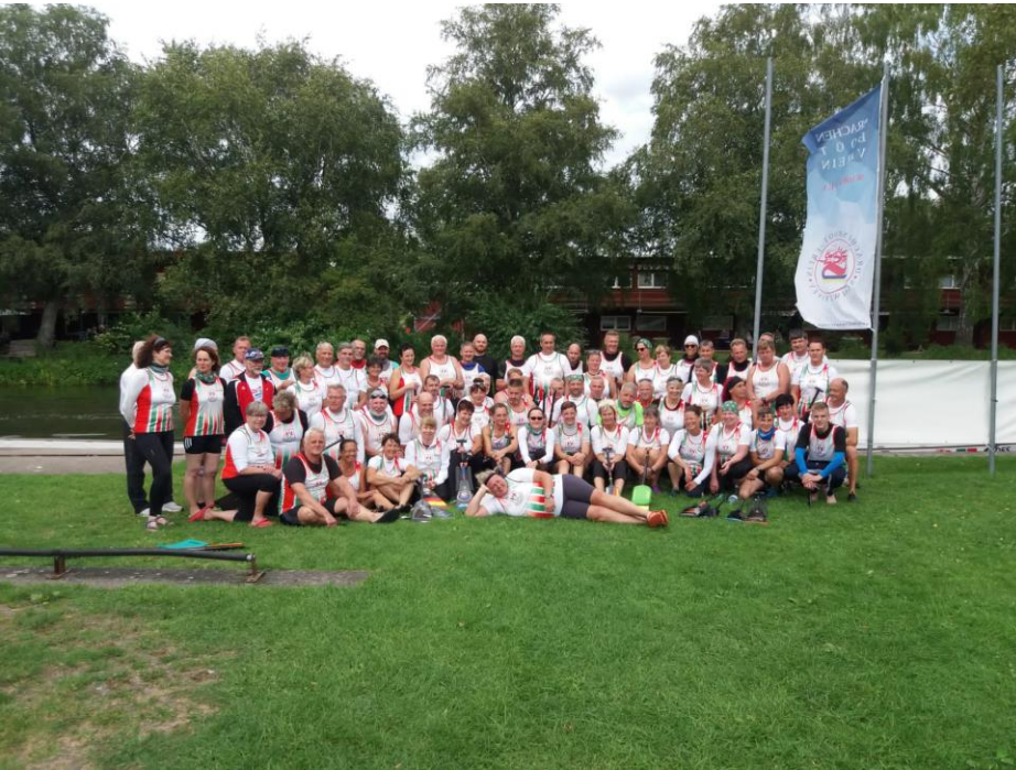
TL SenA / SenB / SenC in Schwerin