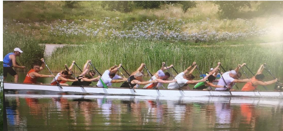
TL SenA in Großkayna